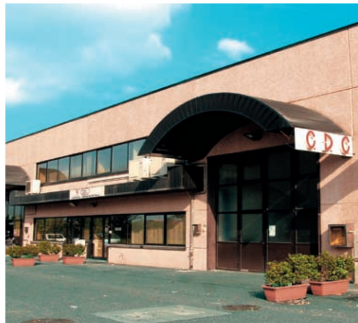
The headquarters in Campi Bisenzio La sede di Campi Bisenzio