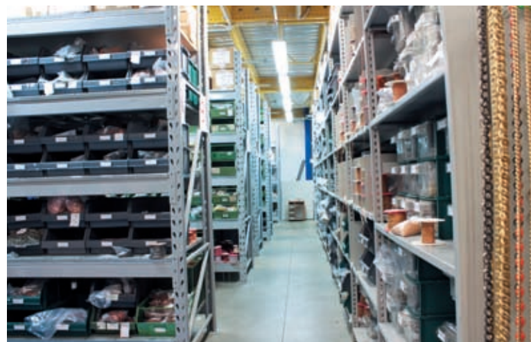
The warehouse in Campi Bisenzio Il magazzino di Campi Bisenzio

A CONTINUALLY UPDATED CATALOGUE OF FIVE THOUSAND MODELS IS THE STRONG POINT OF C.D.C., AN ARTISAN FIRM TECHNOLOGICALLY IN THE VANGUARD