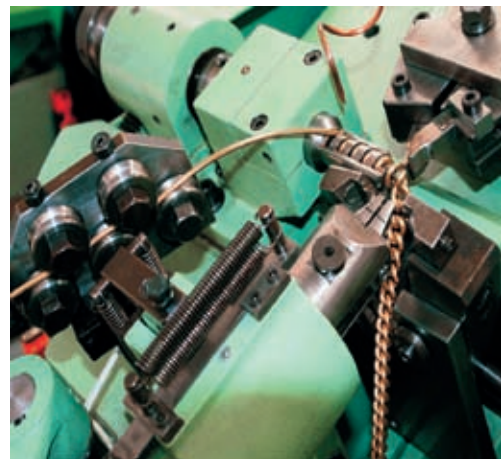
Detail of the machine which makes chains Particolare della macchina per catene